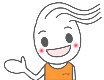
川崎市社協キャラクター ウェーブくん