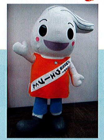
ウェーブくんも来場します♪

さまざまな福祉団体・企業等が一堂に集まり、小さなお子様から高齢者まで、どなたでも楽しめるおまつりです! お誘いあわせのうえ、ぜひご参加下さい♪