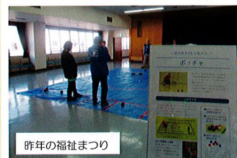
昨年の福祉まつり