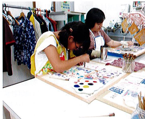
楽しい時間を過ごしましょう♪♪