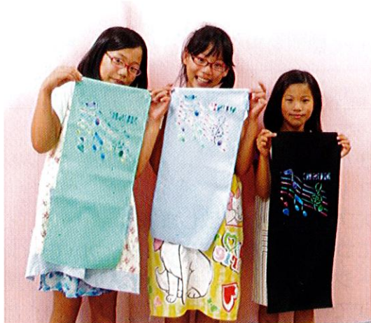
素敵な作品が完成します！！