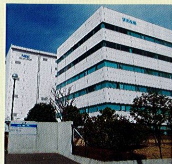
読売川崎富士見ビル

福祉パルかわさきは、平成31年2月25日(月)移転いたしました。今後ともどうぞよろしくお願いたします。