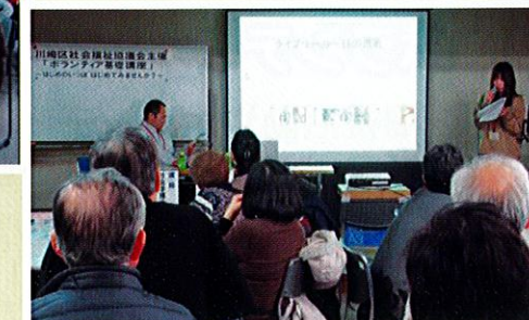
ライプリーわたりだ による事例発表