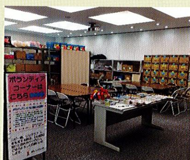
ボランティアコーナー