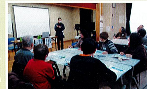
川崎市ふじみ園 による事例発表