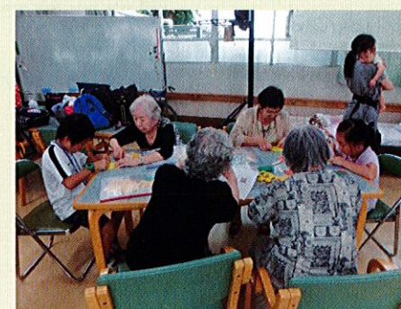
▲ふれあいデイサービスセンター 折り紙で「ひまわり」を折りました。