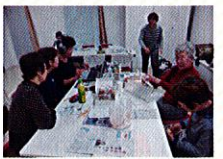
どんな記事も載せるか話し合います。現地取材に行くことも。

あなたの時間と声を活用しませんか。11月7日より朗読ボランティア講習会も開催しています。活動にご興味がある方は問合せ先までご連絡ください！