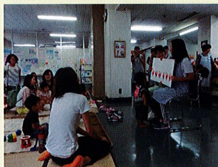
▲子育てサロン大師 読み聞かせや手遊びで遊びました。

夏休みに開催した、川崎市内在住・在学の小学生~大学生までを対象とした「夏休み福祉・チャレンジボランティア体験学習」。川崎区は7プログラム、のべ94名が参加しました。