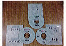
完成！郵送で読者のもとへ届けます。