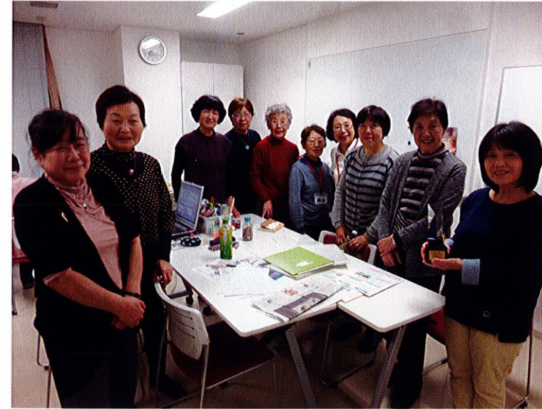
朗読ボランティアの「水車の会」のみなさん。常時30名が役割分担をして活動されています。