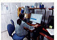
パソコンに向かって録音した音の編集作業です。