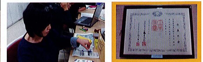
平成20年に緑綬褒章を受章されました。視覚障がいの方が音声で聞く機械。

団体名：水車の会 活動日：毎週火曜日 18時30分~20時30分 団体の活動年数：54年目 活動拠点：川崎市視覚障害者情報文化センター（川崎区堤根3-4-15ふれあいプラザかわさき3階） 問合せ：川崎市視覚障害者情報文化センター 222-1611（活動日時のみ） ボランティア会員数：約50名