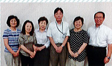
運営スタッフのみなさん

区内で活動するボランティア団体・個人の情報交換の場、ふれあいの場、ネットワーク作りの場です。区内のいろいろな活動を知ったり、自分の活動につながるヒントを学んでいます。ぜひ仲間に入って交流をしていきませんか。会員募集中です!!