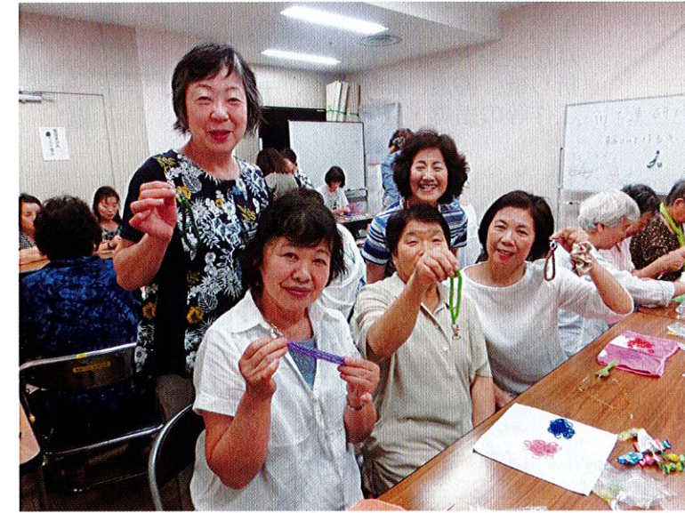
6月24日に開催された、かわぼれん研修会「輪ゴムで作るキーホルダー作り&交流会」の様子。2色輪ゴムを選んで編んでいきます。