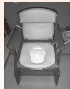
◀NO2 ポータブルトイレ 家具調トイレ 座楽KEN-X