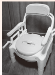
◀NO1 ポータブル トイレFX-CP ソフト便座 替えカバー付 安寿 (取扱説明書あり)