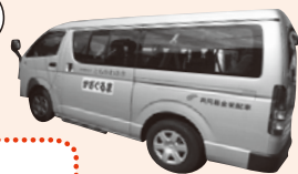
▲(社福)ともかわさきかざぐるま

配分を受けた区内の施設・団体(平成26年度) ・かざぐるま ・なかまの家 ・ひょうたん ・(特) ワーカーズコレクティブたすけあいまりん ・(特) わいわい